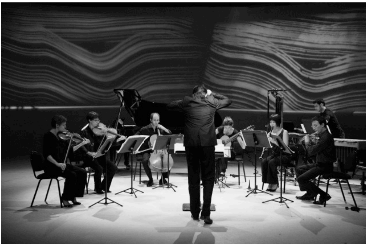
Ensemble Cairn